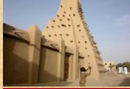
La mosquée Sankoré, Tombouctou, Mali